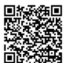
ZX70 3D demo