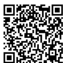
ZX70-EX 3D demo