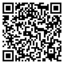
ZX70-EX 3D demo