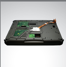
Unidad de expansión PCI/PCI-Express 3.0