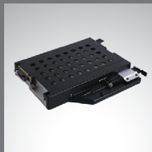
2º almacenamiento en bahía multimedia