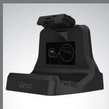
Dock per ufficio