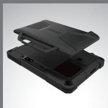
Componente aggiuntivo SnapBack