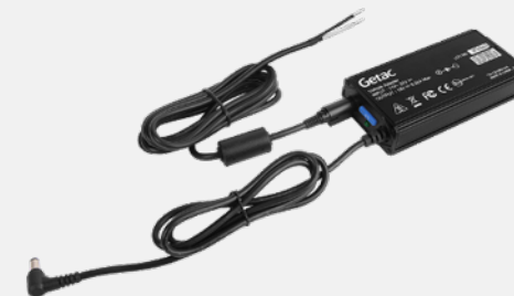
с зачищенными проводами