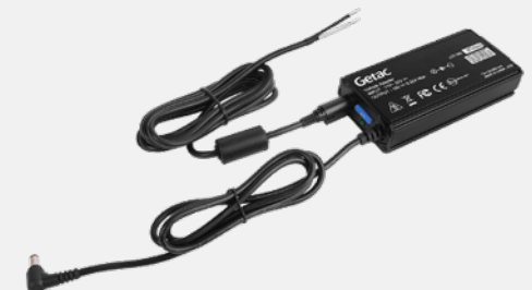
version fils dénudés