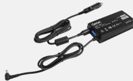
Versión para toma del encendedor