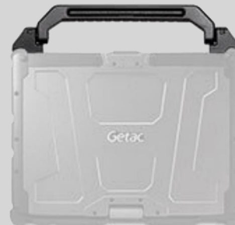
Foto del producto