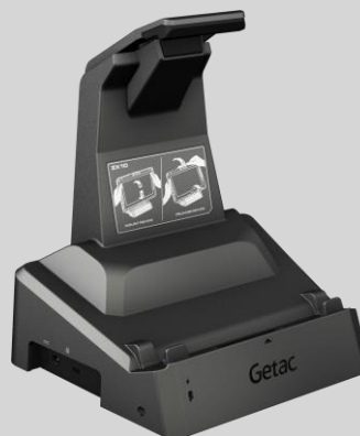
Foto del Producto

* EU = E, US = U, UK = K, AU = A, CHN = C, TW = T - Cables de alimentación