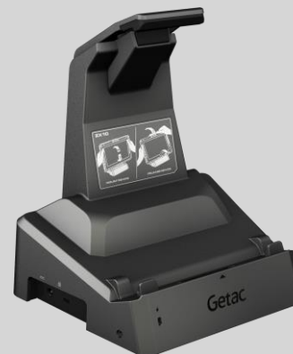
Photo du produit

* UE = E, US = U, UK = K, AU = A, CHN = C, TW = T - Cordons d'alimentation