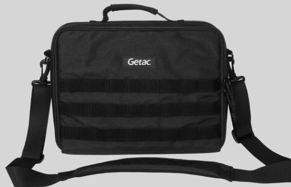
Foto del producto