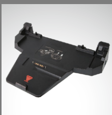
Acoplamiento para escritorio