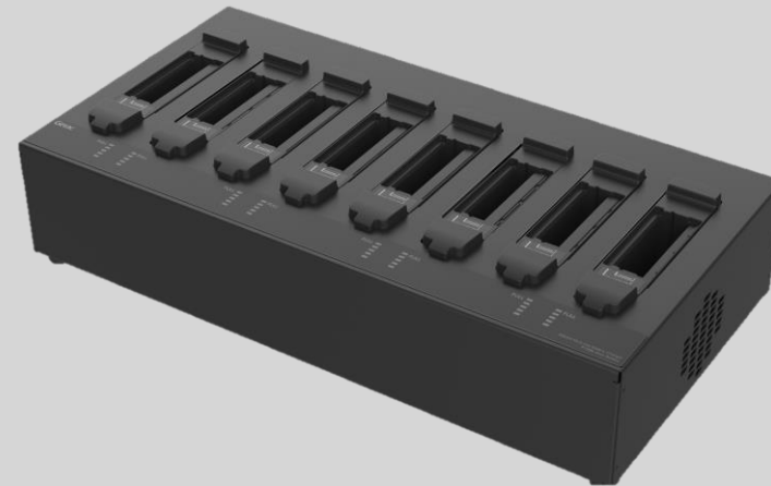
Photo du produit

(à utiliser uniquement dans les zones non dangereuses)