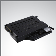
Bahía multimedia 2º almacenamiento