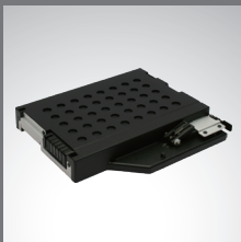
Bahía multimedia 2ª batería