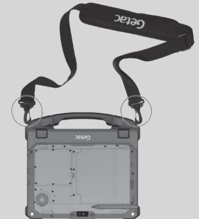
Befestigung der der abnehmbaren Tastatur