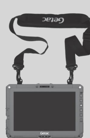
Befestigung am Tablet