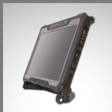
A140 con mango duro multifuncional para uso como base