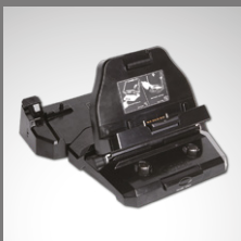
Acoplamiento para vehículo