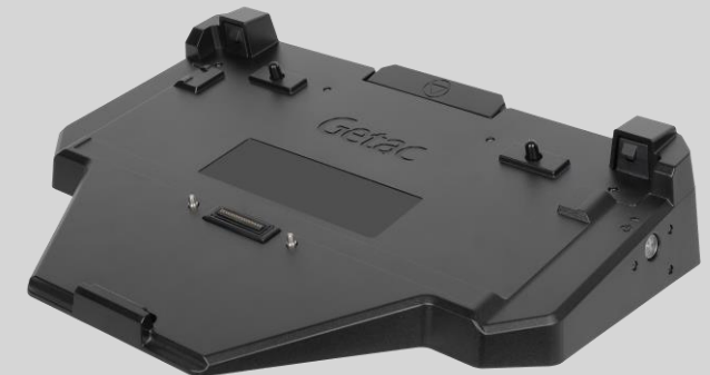
Foto del producto

* EU = E, US = U, UK = K, AU = A, PR = C, TW = T - Cables de alimentación