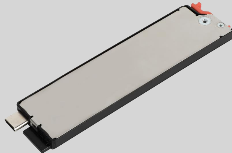
Foto del producto