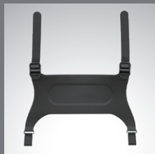
Handriemen aus Gummi