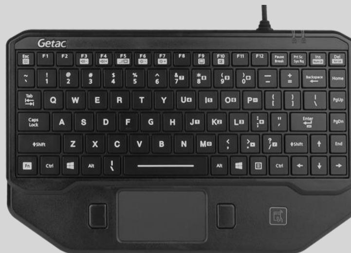
Foto del producto