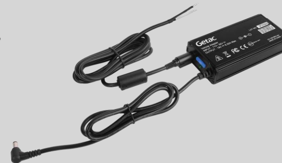
Versión con cable pelado