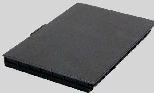
Foto del producto