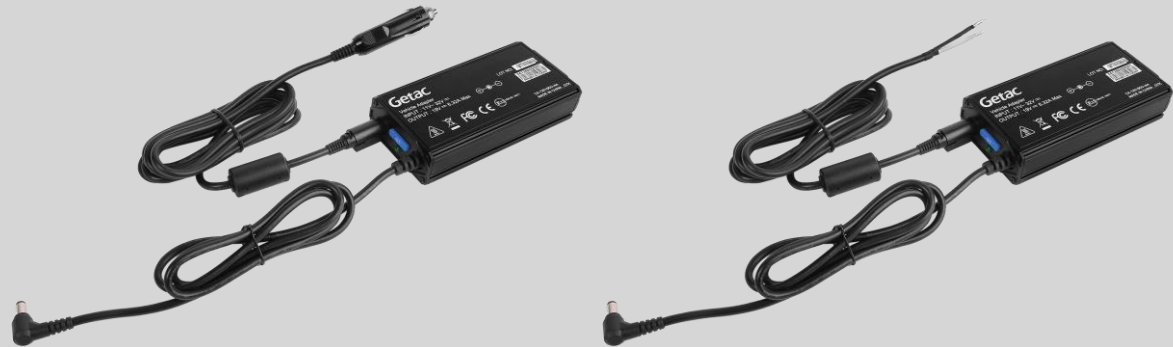
Version mit Stecker für Zigarettenanzünder