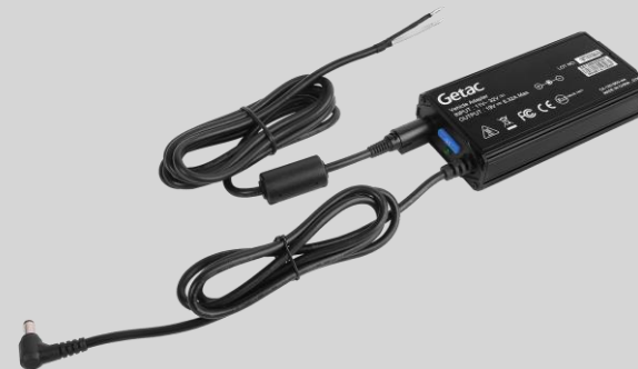
Версия с зачищенными проводами