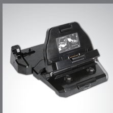
Acoplamiento para vehículo