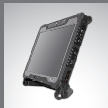
A140 con mango duro multifuncional para uso como base