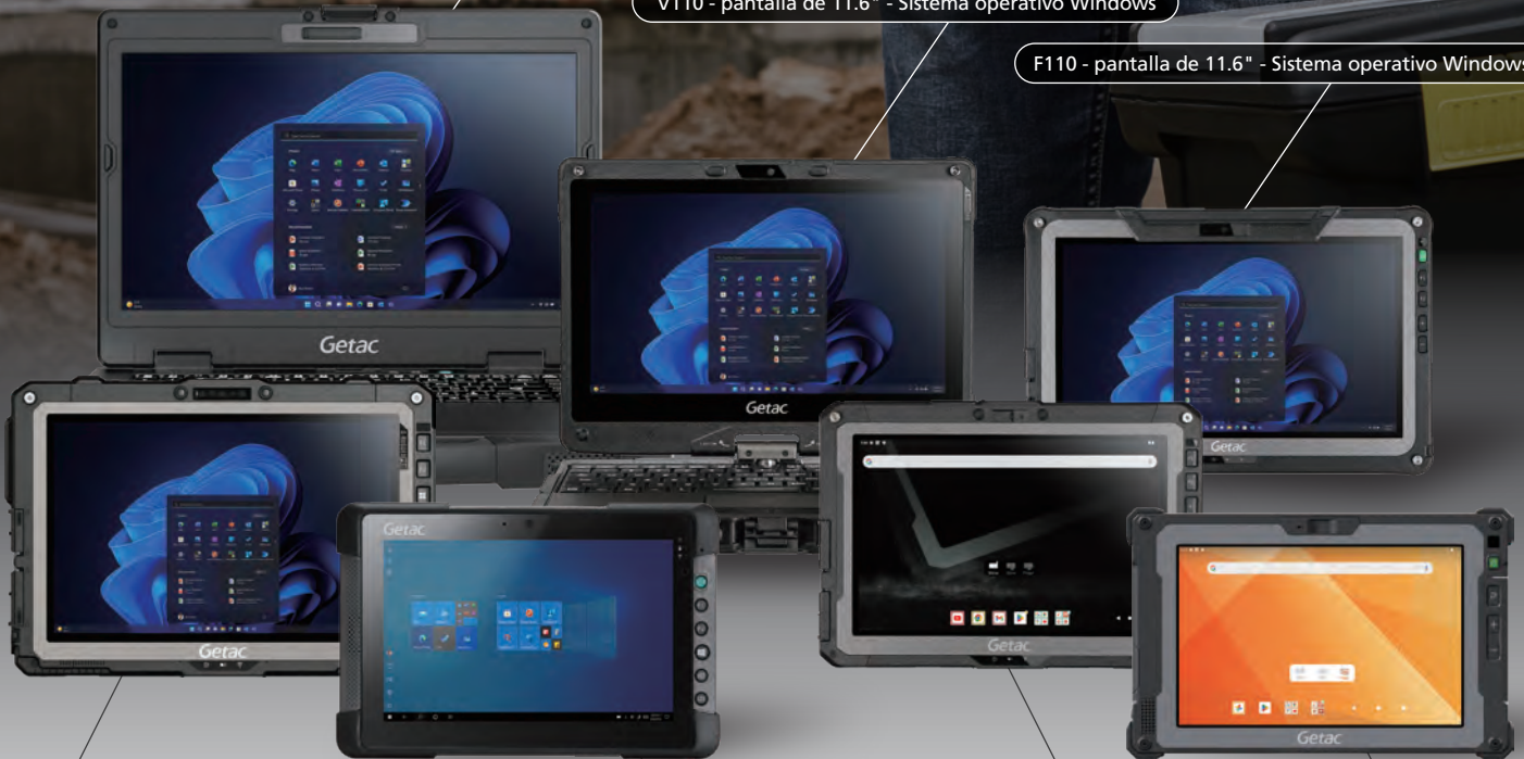
UX10 - pantalla de 10.1" - Sistema operativo Windows