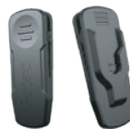
Pince crocodile Getac P/N : 541391850TM4