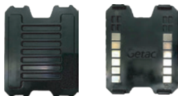
Double Support Magnétique Getac P/N : 541391850TM8