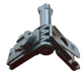
Support Pivotant Getac P/N : 541391850TM7