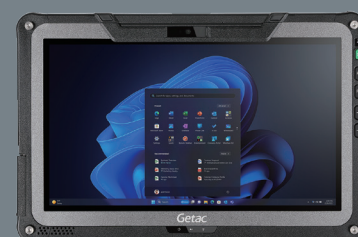
Getac F110 Fully Rugged Tablet